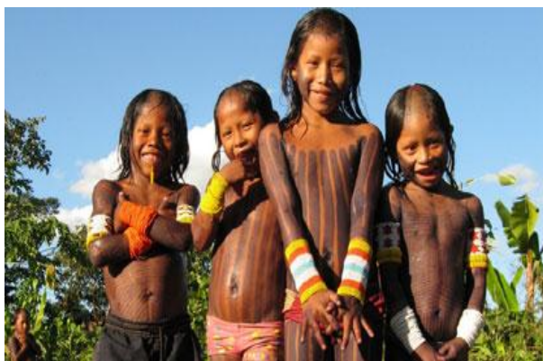
Il coinvolgimento delle comunità e delle popolazioni locali, nonché la tutela dei loro diritti sono requisiti fondamentali della certificazione FSC

Per ottenere la certificazione di una foresta o di una piantagione forestale devono essere rispettati i 10 Principi & 56 Criteri (P&C) di buona gestione forestale definiti da FSC con il consenso delle parti interessate (box 1). Essi vanno dettagliati e adattati alle condizioni locali, per tener conto delle diversità che esistono tra foreste di diversi paesi e regioni del mondo. Per giungere alla certificazione devono essere valutate tutte le modalità con cui è gestita l'area forestale: dalle prime fasi di pianificazione degli interventi, alle fasi operative in campo, fino all'abbattimento e all'estrazione del legname. Inoltre sono fondamentali, sia nella definizione degli standard che durante il processo di certificazione, la partecipazione e il consenso degli stakeholder locali e nazionali, ovvero di tutti i soggetti portatori di vari e diversi interessi (ambientali, sociali, economici) nei confronti della corretta gestione della foresta.