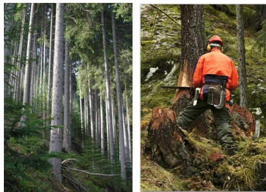
Tutela dell'ambiente e sicurezza dei lavoratori sono garantiti dalla certificazione FSC

perché semplifica le difficoltà operative e riduce i costi.