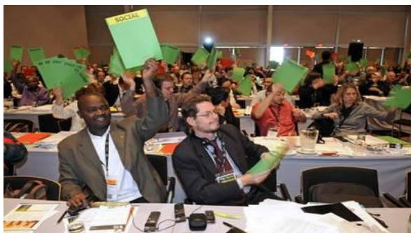
Votazione nell'ambito dell'Assemblea Generale FSC 2008

Creato nell'ottobre 1993, il Forest Stewardship Council (FSC) è un'organizzazione non governativa e no-profit che include tra i suoi quasi 900 membri internazionali gruppi ambientalisti (es. Greenpeace, WWF e Legambiente) e sociali, comunità indigene, proprietari forestali, industrie che lavorano e commerciano il legno e la carta, gruppi della grande distribuzione organizzata (es. Ikea e Castorama) ricercatori e tecnici, che operano insieme allo scopo di promuovere in tutto il mondo una gestione responsabile delle foreste. L'Ong FSC è governata da un organo decisionale sovrano, l'Assemblea Generale dei soci, suddiviso in 3 Camere: una che rappresenta gli interessi ambientali, una gli interessi sociali, una gli interessi economici. Il potere di voto è equamente distribuito fra le 3 Camere (1/3 dei voti per ciascuna di esse) e tiene conto del bilanciamento degli interessi dei Paesi del Sud del mondo rispetto a quelli del Nord.