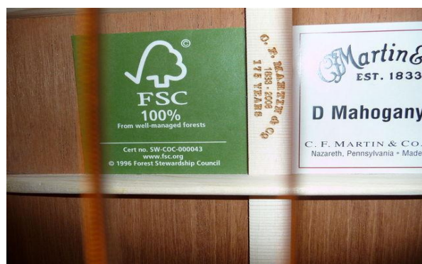
Esempi di prodotti con il logo FSC