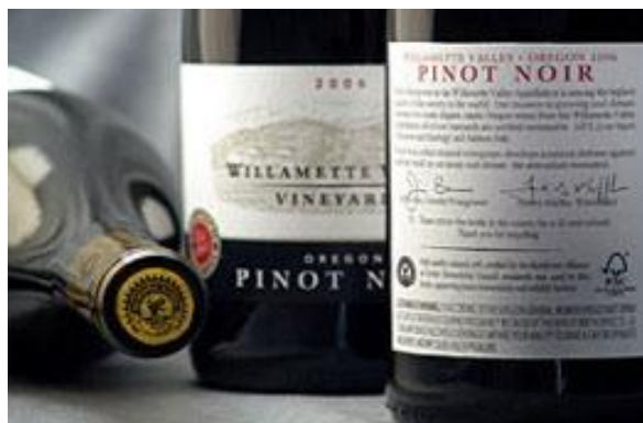
Prodotti forestali non legnosi certificati, un esempio: bottiglie di vino con tappo in sughero certificato FSC