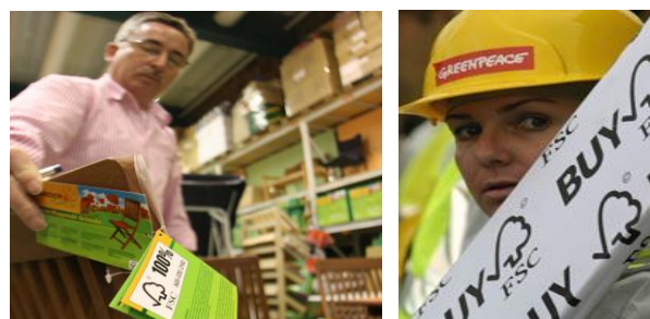
L'acquisto di prodotti certificati FSC, una scelta responsabile

Scegliendo prodotti certificati FSC, i consumatori possono contribuire attivamente ad una migliore gestione delle foreste in tutto il mondo, stimolando la certificazione di nuove aree forestali e di nuove aziende di trasformazione del legno.